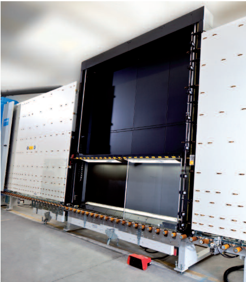
Automatische Einstellung der Rahmenanschläge auf die jeweilige Glasdicke