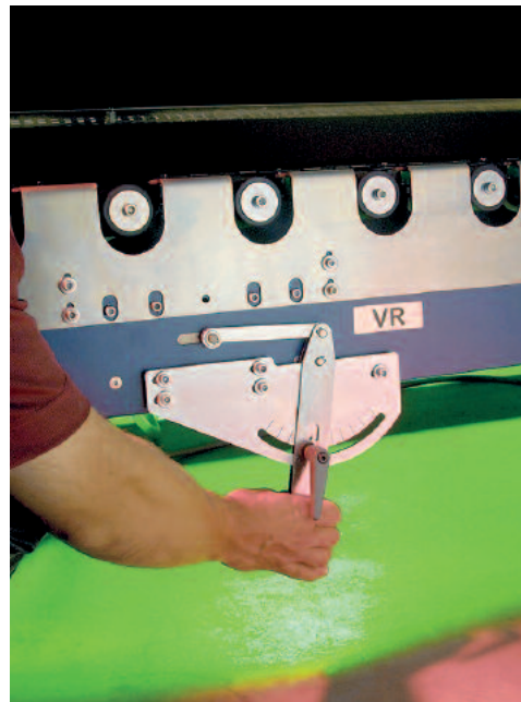
Schnellverstellung für Rahmenrückstand