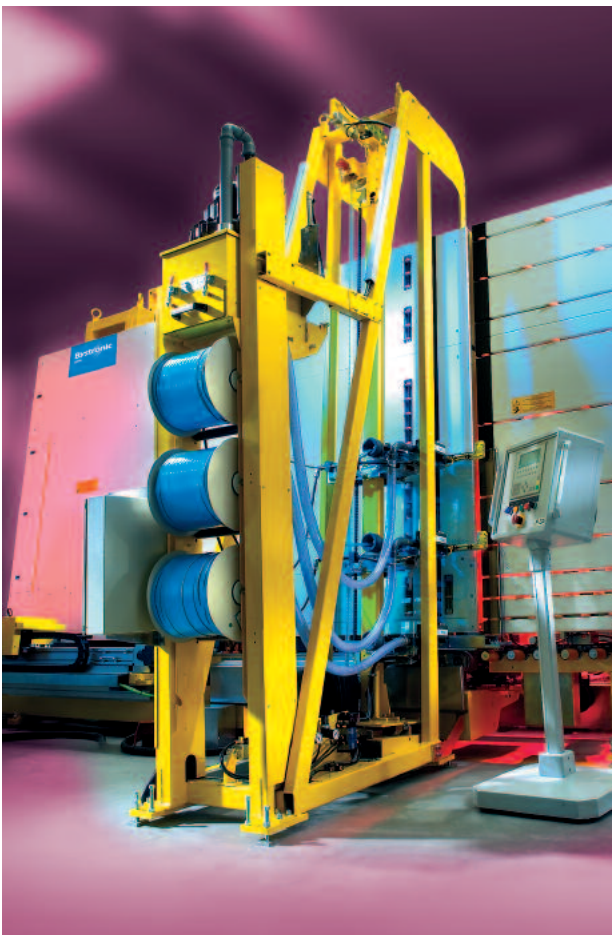
Type DA-VS: Application sur la face avant du vitrage isolant