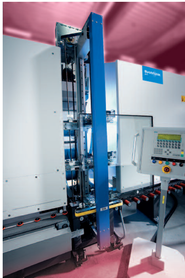
Type DA-HS: Application sur l'arrière du vitrage isolant